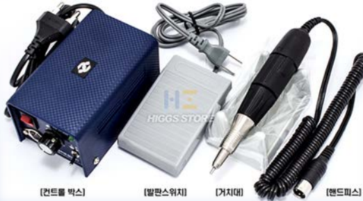
[컨트롤 박스] [발판스위치] [거치대] [핸드피스]