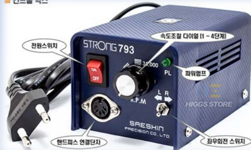
전원스위치, 속도조절 다이얼 (1 - 4단계), 파워램프, 손잡이, 정/역회전 스위치, 핸드피스 연결단자

3D프린터 판매 및 A/S, 시제품제작, 3D출력서 각종 정밀기기 제작, 전자교탁 판매 및 A/S 음향기기 판매·설치·수리, DJ드론 판매점 3D프린팅 교육서비스, 무대조명기기 판매 전기전자기기 판매, CCTV 장비 판매 및 설치